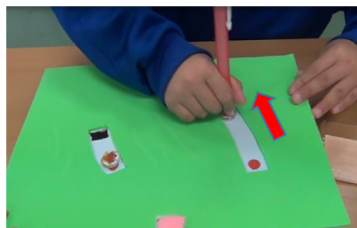
②おはじきを運びながら溝をなぞる。