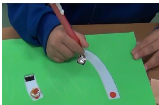
③終点の穴におはじきを落とす。