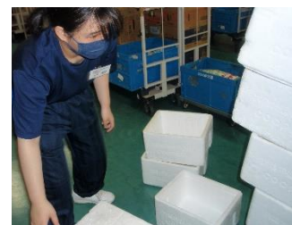
ハーツ配送センター